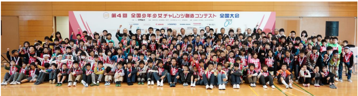
全国大会（出場全チームの記念撮影）