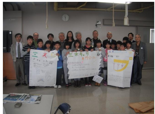
地域活性化アイデア創作活動 各グループの活動内容の発表