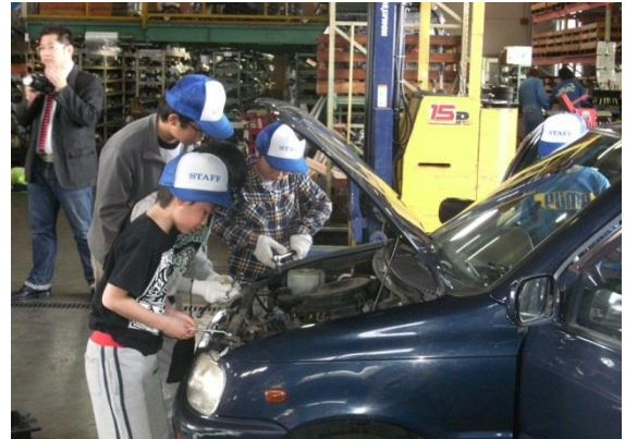
実製品から学ぶ（自動車の分解）