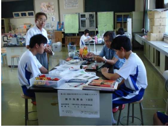
地区大会（創作指導会）

①の事業の活性化を図るため、各地域の少年少女年発明クラブの協力の下、3名1チームで統一課題に挑戦する「 全国少年少女チャレンジ創造コンテスト 」の地区大会及び全国大会を実施する。