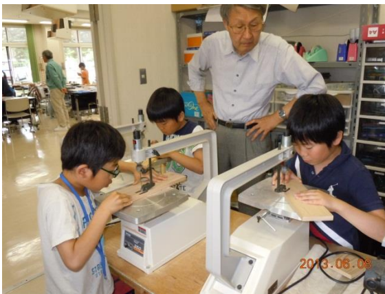
課題工作「木工工作」