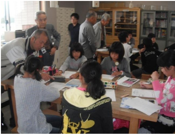
地域活性化アイデア創作活動 グループ毎の活動内容の企画