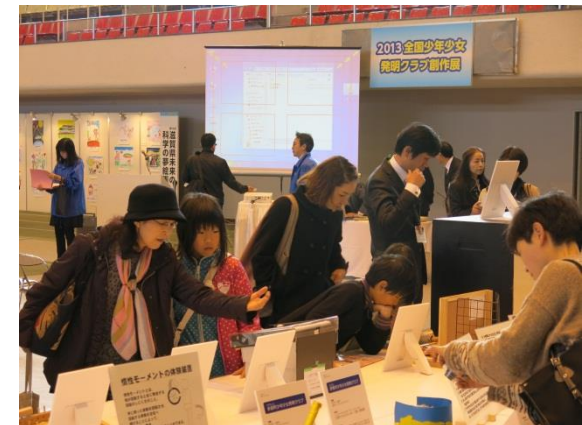
全国会議（少年少女発明クラブ創作展の見学）