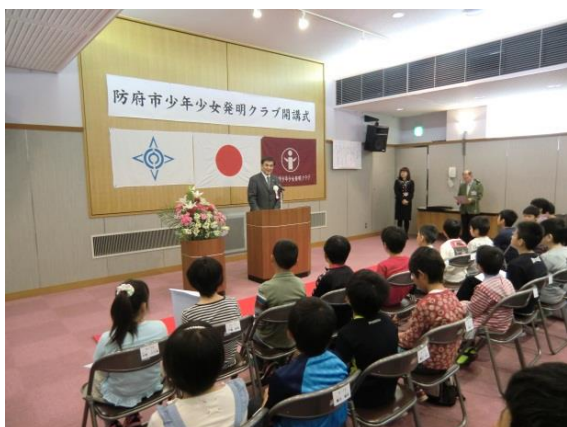
少年少女発明クラブ開講式（防府市）

地域を拠点として活動を行う 少年少女発明クラブ （全国215箇所）での知的創造体験活動を支援するとともに、地域社会の具体的な課題を子ども達の知恵で解決する「 地域活性化アイデア創作活動 」を実施する。また、各地域の指導員の資質向上のための会議・研修会を開催する。更に、これら活動の広報のため、ホームページの運営と「 クラブニュース 」の発行を行う。