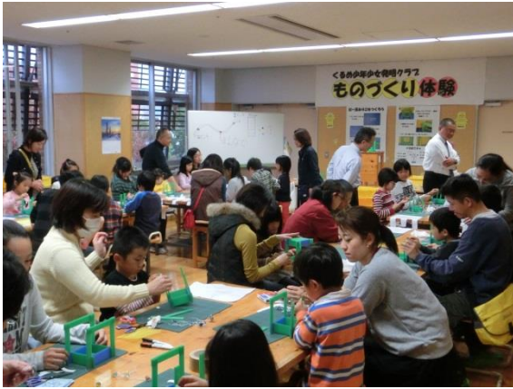
公開発明教室の開催（福岡県久留米市）