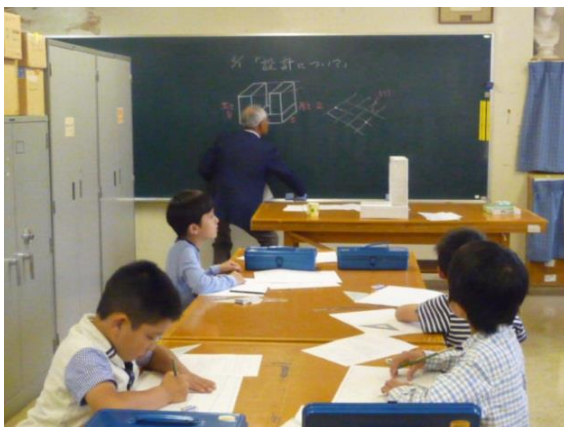
自由アイデア作品の製作（設計図の書き方）