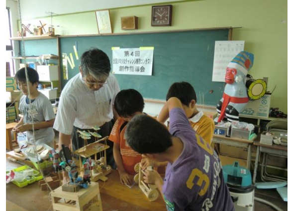
地区大会（創作指導会）