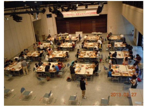
公開発明教室の開催（岩手県花巻市）