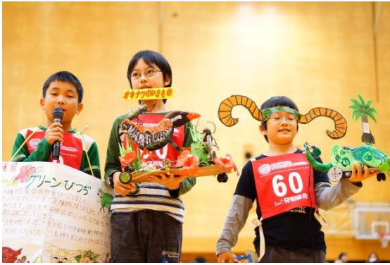
全国大会（作品プレゼンテーション）