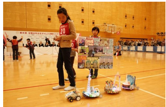
全国大会（競技コンテスト）