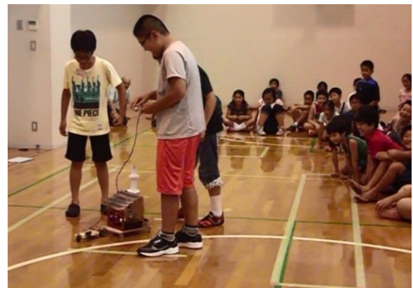
地区大会（コンテスト大会 東京都台東区）