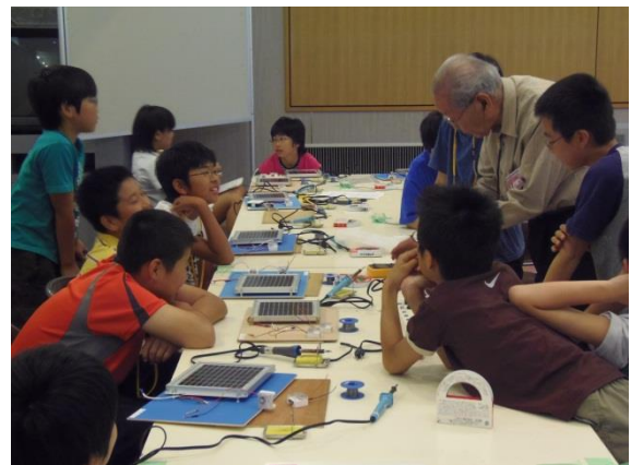
電気工作「太陽光発電機の製作」