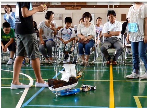
地区大会（コンテスト大会 宮城県仙台市）