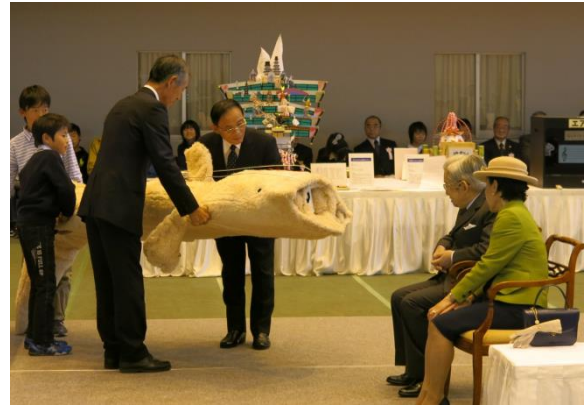
常陸宮殿下同妃殿下による 少年少女発明クラブ創作展御観覧