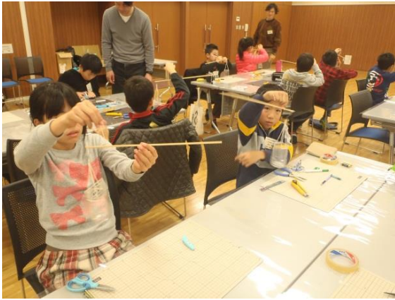
課題工作「ペットボトルの活用」