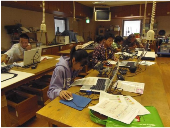
電子工作「プログラム・ロボットの製作」