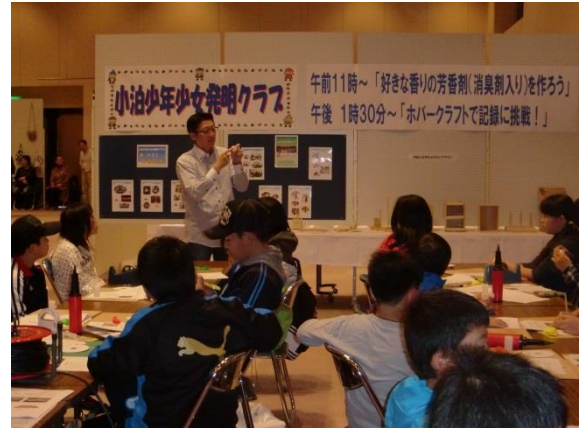
公開発明教室の開催（青森県中泊町）