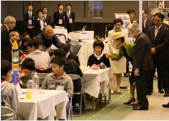
常陸宮殿下同妃殿下による 滋賀県内の少年少女発明クラブ合同活動御視察