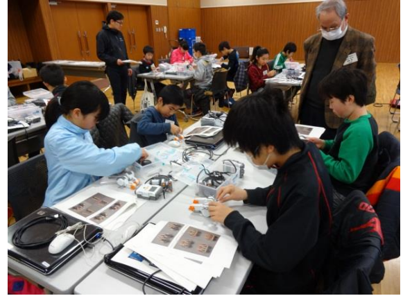
電子工作「プログラム・ロボットの製作」