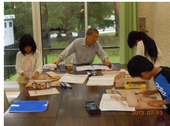
課題工作「木工工作」