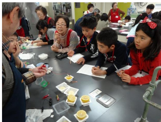
科学実験「レモン電池」