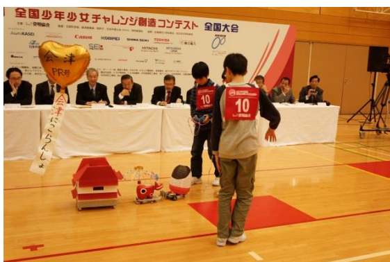
全国大会（競技コンテスト）