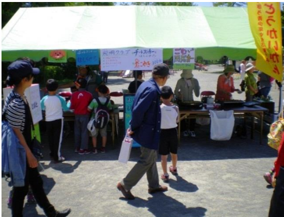
公開発明教室の開催（北海道札幌市）