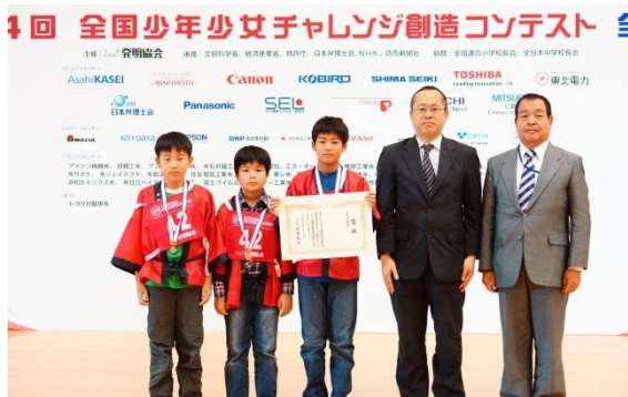
全国大会（JKA会長賞：山口県代表チーム・作品）