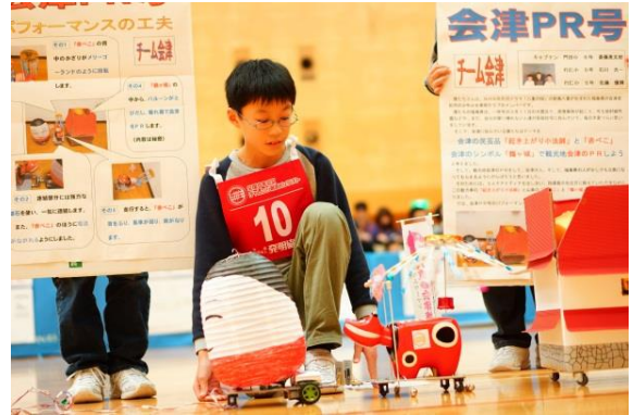
全国大会（作品プレゼンテーション）