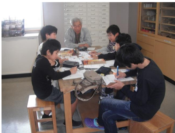
地域活性化アイデア創作活動 グループ毎の活動内容の企画