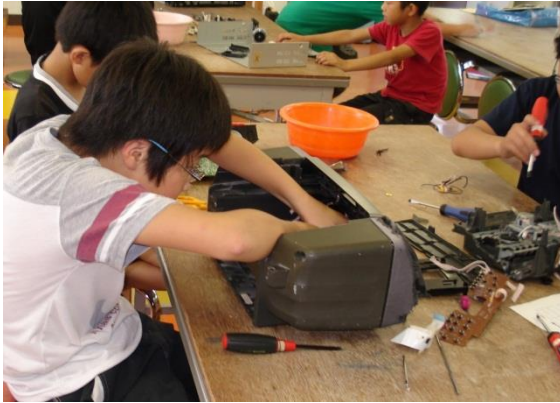
実製品から学ぶ（家電製品の分解）