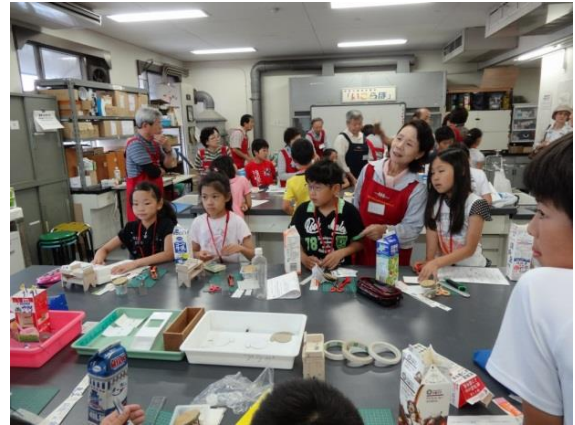
課題工作「牛乳パックの活用」