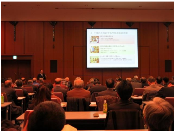
全国会議（指導員による活動状況発表）