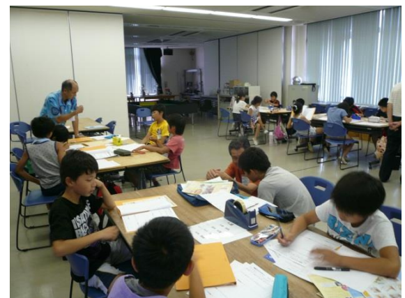
自由アイデア作品の製作（作品企画書書き方）