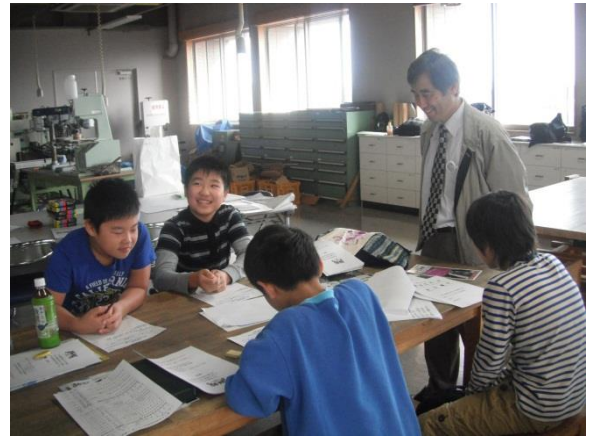
地域活性化アイデア創作活動 グループ毎の活動内容の企画